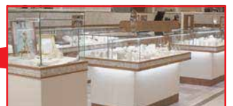
国分寺マルイ 2階 ジュエリー工房イルディア